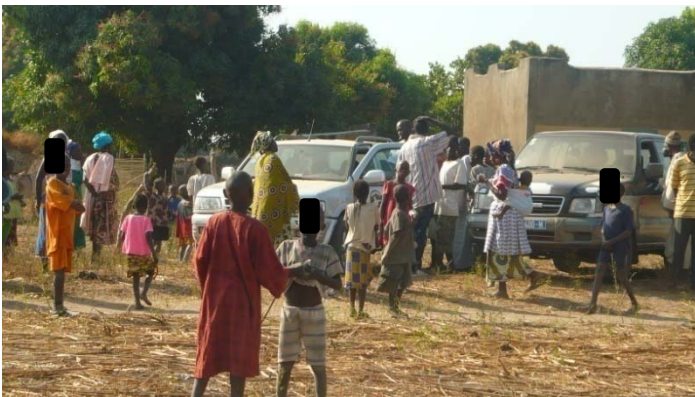
Arrivée du Samusocial dans un village de Guinée Bissau